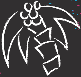
Urlaub mit meinen Freunden