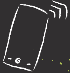
Mein neues Handy