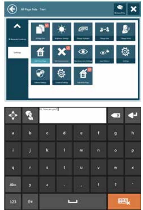
Das „Schnellmenü“ bietet Ihnen als Betreuer Zugriff auf häufig genutzte Einstellungen und Funktionen in Communicator 5.