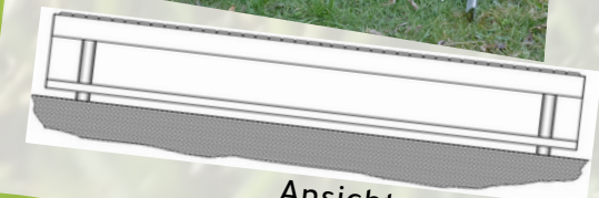
Ansicht von hinten